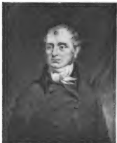
Franz Xaver Bichat.

Der Vitalismus fand besonders in Montpellier eine Heimstätte. Schon Sauvages (1706—1767) hatte den Versuch gemacht, die Stahl'sche «Anima» und die hippokratische γένεσις mit einander zu verbinden. Wichtig ist seine